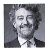
NICOLÒ PELANDA DIRITTO PENALE COMMERCIALE