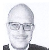
FRANCESCO CAMPANELLA FINANZIAMENTI D'AZIENDA